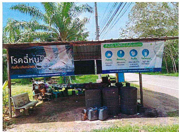
หมู่ที่ ๓