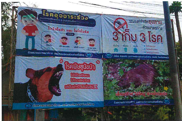
หมู่ที่ ๔