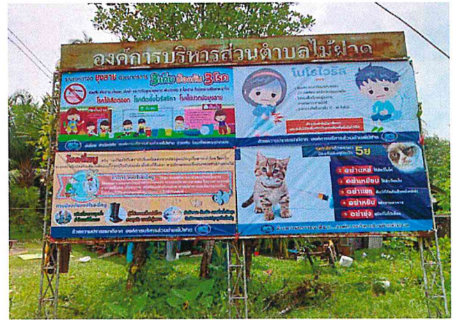
หมู่ที่ ๕