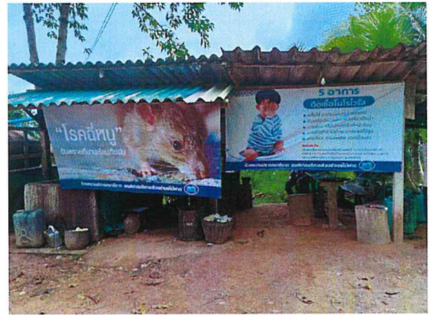
หมู่ที่ ๗