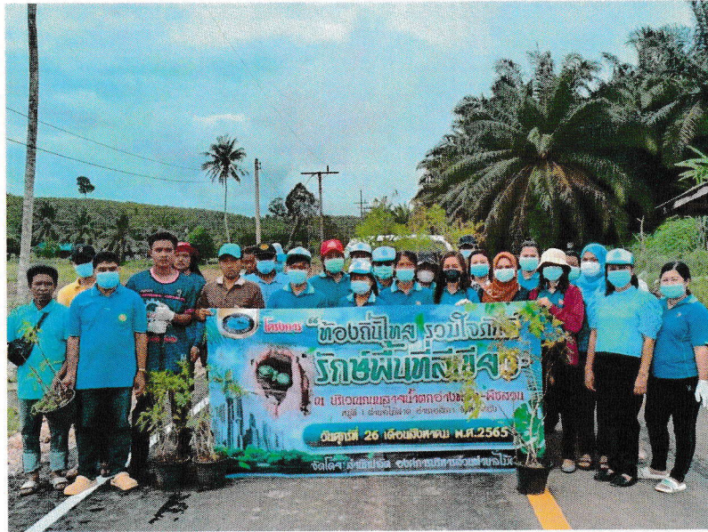
ภาพถ่ายโครงการท้องถิ่นไทย รวมใจภักดี รักษาพื้นที่สีเขียว องค์การบริหารส่วนตำบลไม้ฝาด อำเภอเสีเกา จังหวัดตรัง